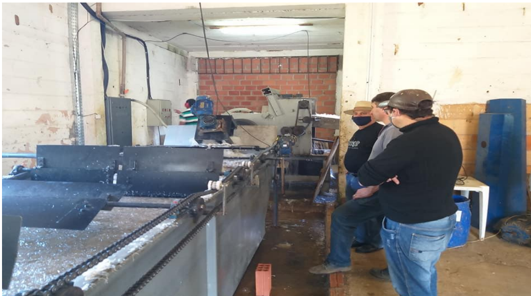
Foto 07- Visita a empresa CAPLAST