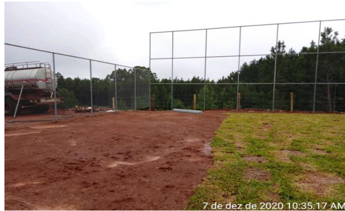
FOTO 04- Construção campo futebol 11