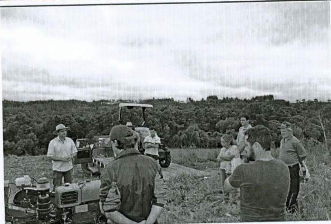
Dia e campo sobre Máquinas e Equipamentos