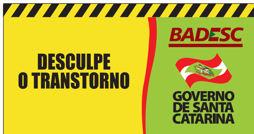
Cavalete de Obra