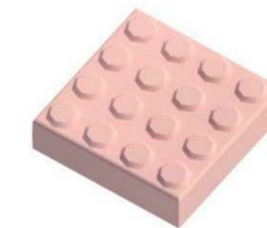
2 Piso Alerta