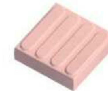
3 Piso Direcional