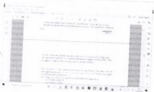
Pag 3 - Manual X1.png ~258 KB