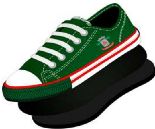
Vista externa (Foto Ilustrativa)

Por se tratar de um produto em produção fabril, exige-se que as dimensões dos calçados acompanham os padrões comerciais baseados na escala francesa cujo fator de conversão é 0,66667 centímetros de número a número. A medida realizada em calçado já confeccionado deverá ser efetuada na palmilha amortecedora ou palmilha de overloque, com variação permitida de 3% (+/-). Deve ter o Brasão do órgão aplicado na Lateral do Tênis. A marca da amostra deverá ser a mesma constante na proposta de preços junto com os laudos e consequentemente deverá permanecer inalterada durante toda a vigência da ata de registro de preços, sob pena de desclassificação e/ou cancelamento da ata.