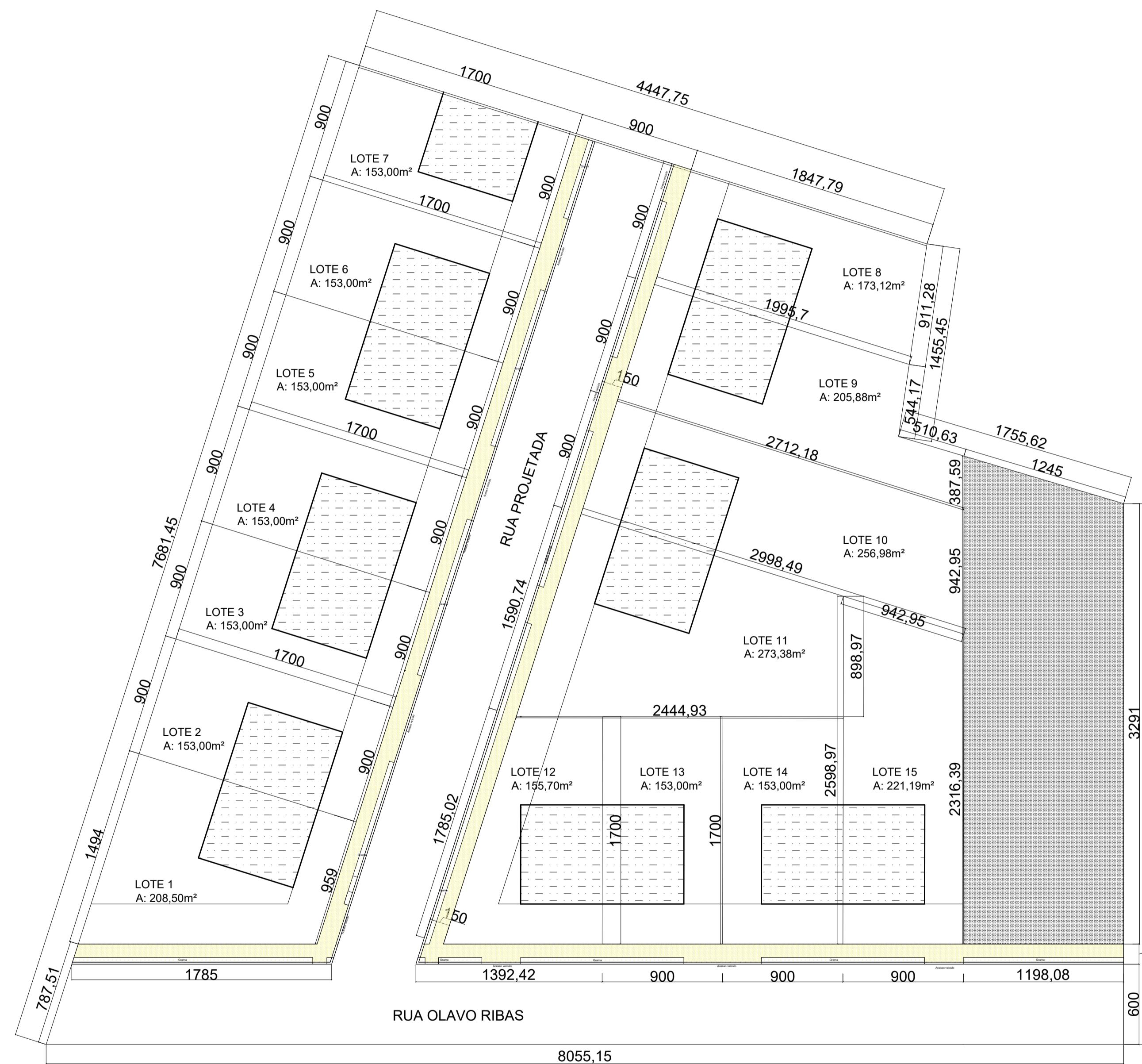
1 LOTEAMENTO ESCALA 1/250