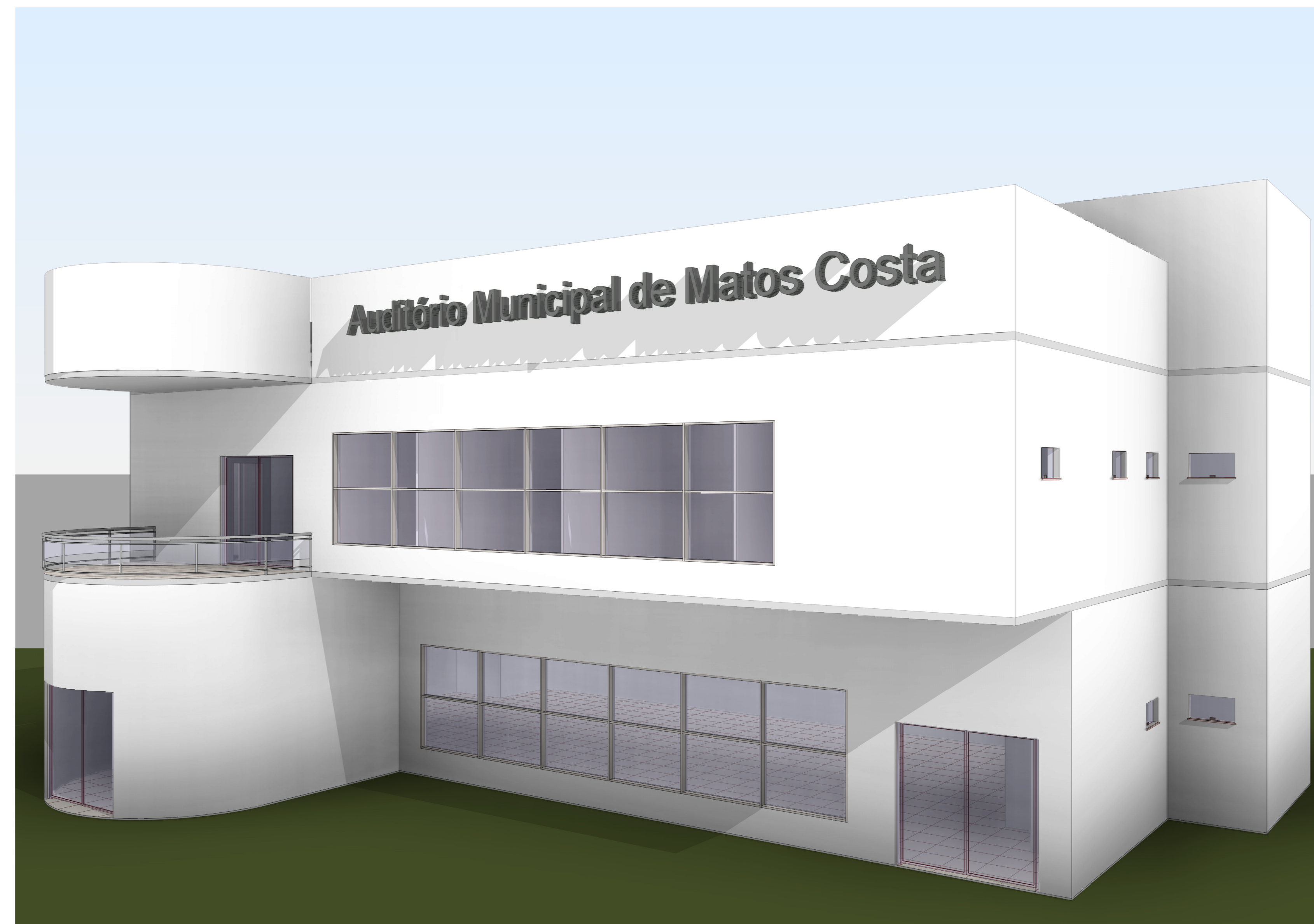
3 Vista 3D