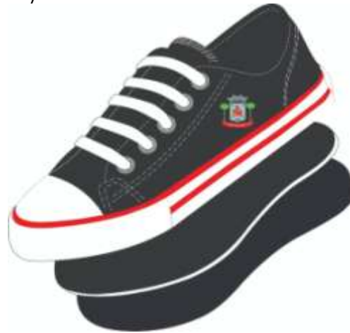
Vista externa (Foto Ilustrativa)

Por se tratar de um produto em produção fabril, exige-se que as dimensões dos calçados acompanham os padrões comerciais baseados na escala francesa cujo fator de conversão é 0,66667 centímetros de número a número. A medida realizada em calçado já confeccionado deverá ser efetuada na palmilha amortecedora ou palmilha de overloque, com variação permitida de 3% (+/-). Deve ter o Brasão do município aplicado na lateral do Tênis. A marca da amostra deverá ser a mesma constante na proposta de preços junto com os laudos e conseqüentemente deverá permanecer inalterada durante toda a vigência da ata de registro de preços, sob pena de desclassificação e/ou cancelamento da ata.